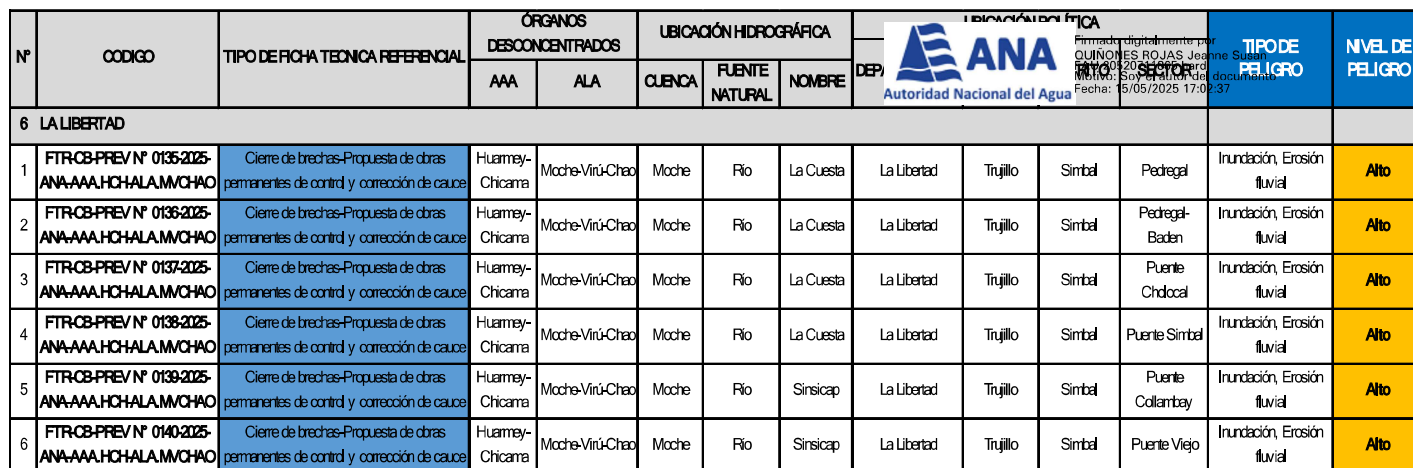
Cuadro N° 1 Fichas técnicas referenciales de puntos críticos, como propuestas de intervenciones de prevención, identificados en el ámbito del departamento de La Libertad, 2025

“Decenio de la Igualdad de Oportunidades para Mujeres y Hombres” “Año de la recuperación y consolidación de la economía peruana”